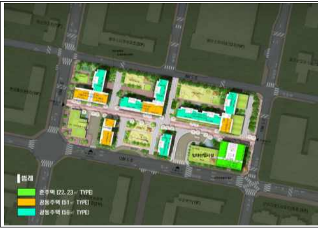
< 배치도 >