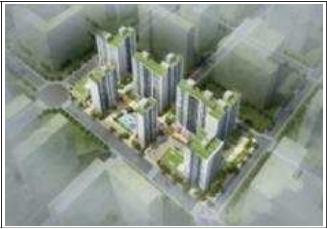
< 조감도 >